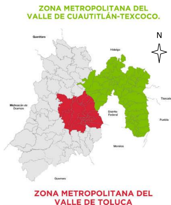
Mapa 1 Localización de las dos zonas metropolitanas del Estado de México, 2008