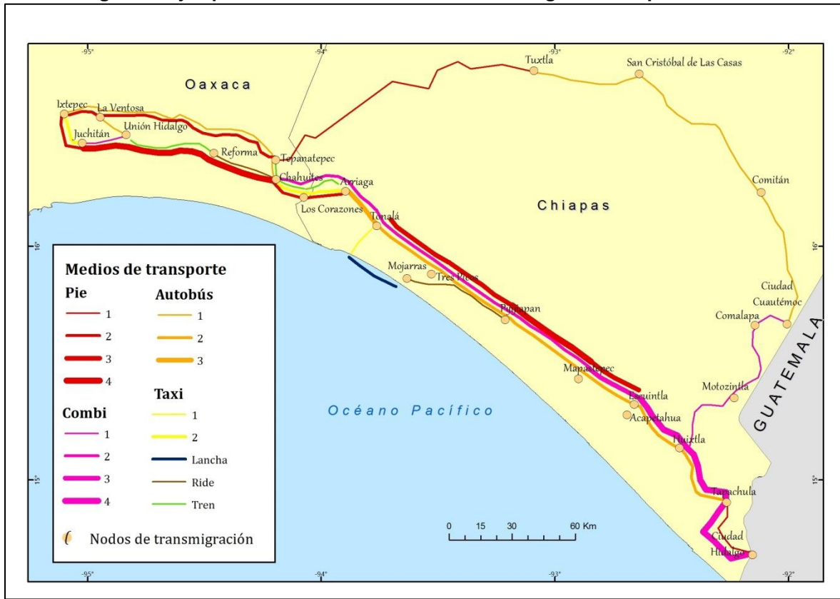
Figura 2. Ejemplo de diversificación de las rutas migratorias a partir del PFS