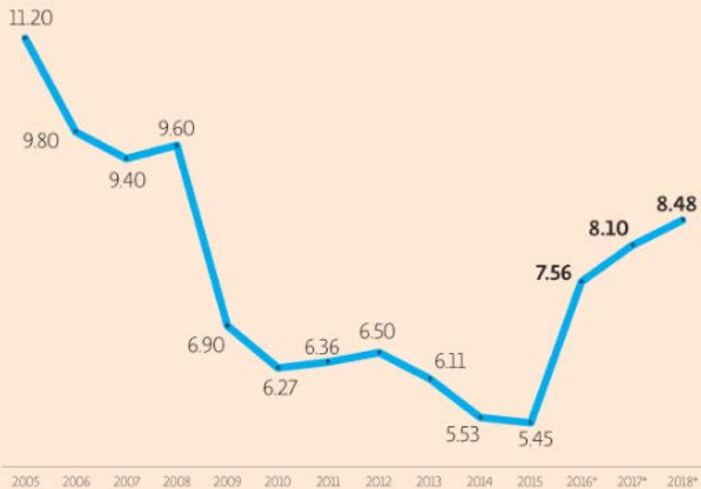
TASA DE INTERÉS PROMEDIO PONDERADA DE LOS FINANCIAMIENTOS CIFRAS EN % ANUAL NOMINAL-PRIMER TRIMESTRE DE CADA AÑO

La tasa de interés promedio ponderada de los financiamientos adquiridos por los estados fue de 8.48% en el primer trimestre del 2018, el mayor porcentaje desde el 2008; a partir del 2016 este indicador comenzó a aumentar, a pesar de que los gobiernos locales utilizaron el refinanciamiento para mejorar las condiciones de mercado, aunque esto no se ha logrado debido al incremento de la tasa objetivo de Banxico.