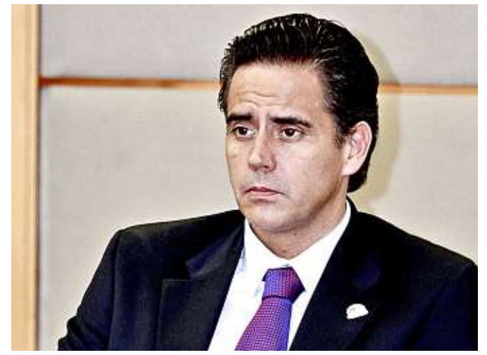
Fernando Solís Soberón, director general de banca de Ahorro y Previsión de Banorte y ex presidente de la Consar.

Los trabajadores del IMSS contribuyen con 6.5 por ciento de su salario mensual, mientras que los trabajadores del ISSSTE lo hacen con 11.3 por ciento, ambas tasas de contribución son de las más bajas de entre los países