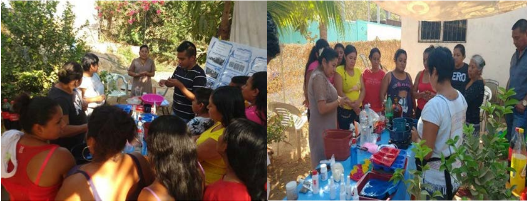
Figuras 4 y 5. Segundo taller por mujer indígenas Ñuu Savi y Me ´ Phaa