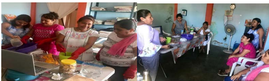
Figura 2 y 3. Preparado de jabones con las mujeres amuzgas.

El 29 de julio de 2019 en las instalaciones de la UIRA se realizó el primer taller con un grupo de mujeres indígenas amuzgas a quienes se les explicaron los procedimientos, cuidados, costos, ventajas y desventajas en la elaboración de jabones con aceite reciclado. Se les explicó en la lengua materna ya que algunas de las mujeres no comprendían el español. Se discutió con ellas cuales pudieran ser los residuos sólidos domésticos (cáscaras de jabón, asientos de café, etc.) que ellas tuvieran a la mano y pudieran incorporar a la preparación de los jabones.