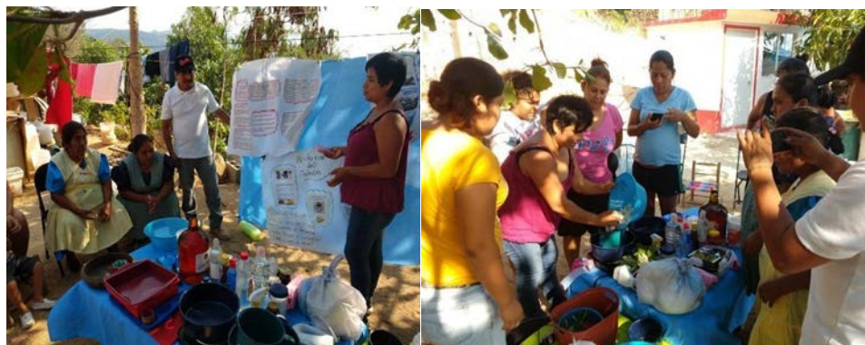
Figuras 5 y 6. Tercer taller con mujeres nahuas