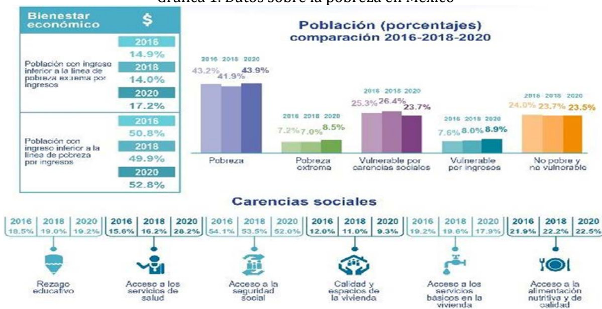
Gráfica 1. Datos sobre la pobreza en México

información ofrece un primer panorama completo de las implicaciones de la pandemia en el ingreso y, las carencias sociales de las y los mexicanos en 2020” (CONEVAL, 2022:88).