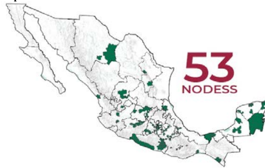
Mapa 2. Red Nacional de NODESS en México, 2022