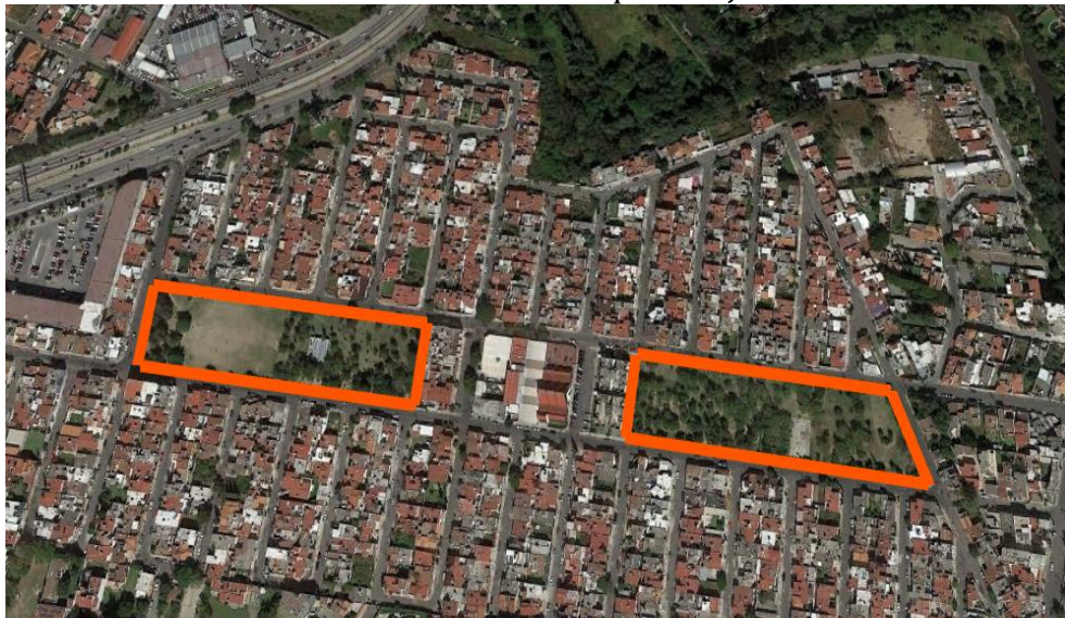
Ilustración No. 6 Parque San José