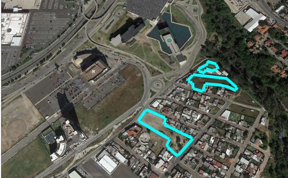
Ilustración No. 4 Mira Atoyac