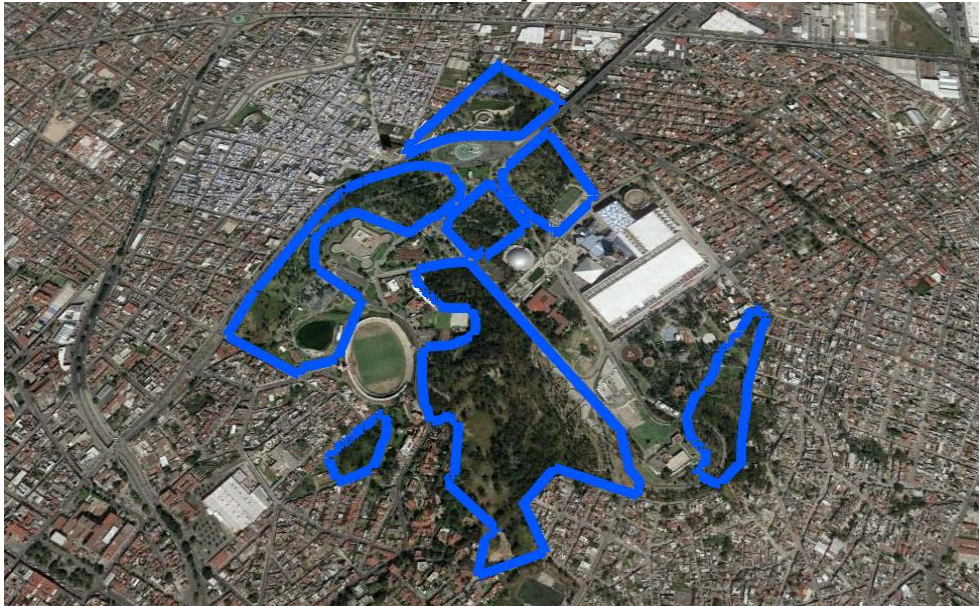
Ilustración No. 3 Parque de los Fuertes