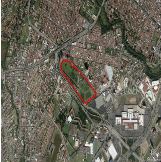
Ilustración No. 1 Jardín del Arte