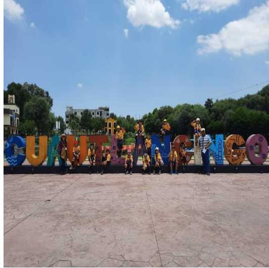
Ilustración No. 2 Parque Ameyal