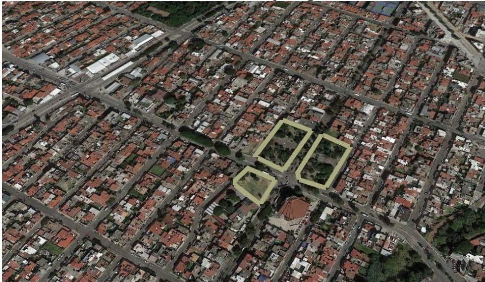
Ilustración No. 7 Parque Agua Azul