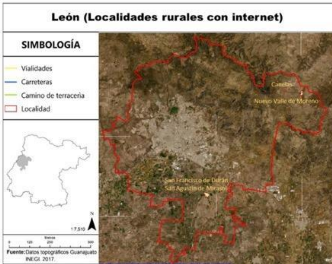
Mapa 1. Localidades seleccionadas con disponibilidad de señal de internet