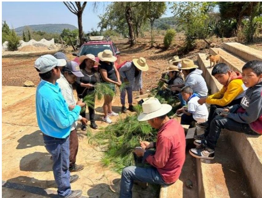
Ilustración 1. Corte de la hoja del árbol de ocote

Nota: tequio de la comunidad para la elaboración de festones, fotografía propia.