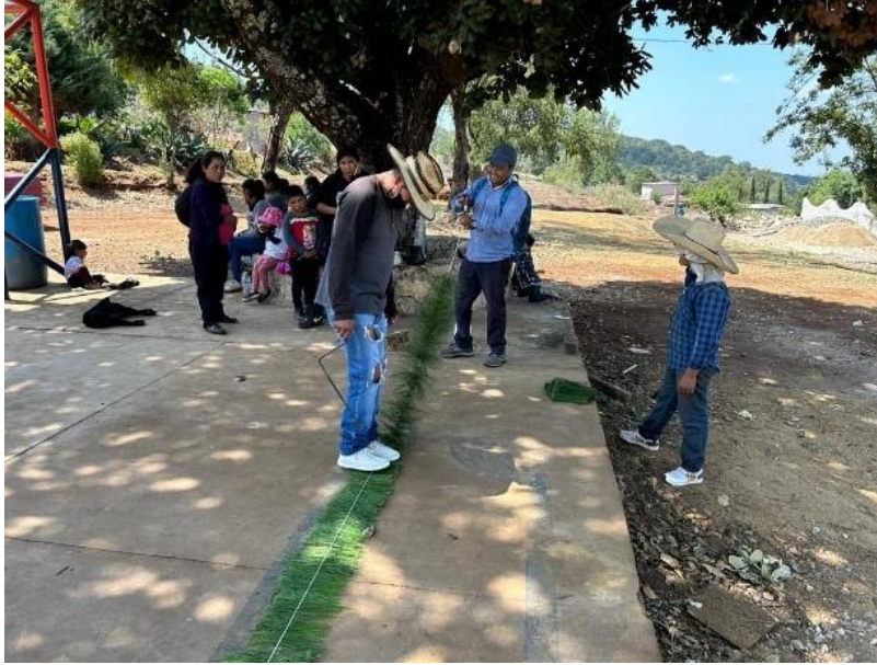
Ilustración 2 Festón. El festón en un adorno tradicional de la comunidad

Día 12 de mayo: se tuvo que ir Nochixtlán la ciudad más cercana a hacer compras de flores, plásticos, cuetes, entre otras cosas que se ocuparían en la comunidad, nos tomó todo el día, regresando a la comunidad al redor de las 4pm, llegando a comer y yendo a adornar la iglesia. Es increíble todo lo que tenemos que hacer para una festividad.