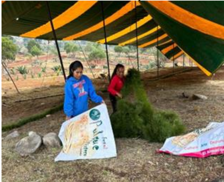
Ilustración 3. Colocación de los festones y lonas de la feria del pulque

Por la tarde se fue a adornar el lugar donde sería la feria del pulque, colocando los festones y las artesanías. Se asignaron espacios que serían utilizados para aquellas personas que estarían participando en la feria: productoras de pulque, vendedoras de comida, productores de alimentos de la región, músicos, grupo folclórico y autoridades municipales.