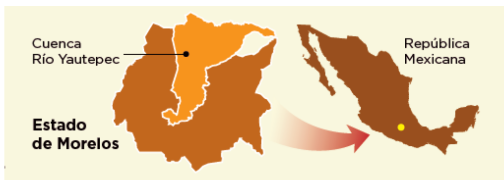
Figura 1: Ubicación de la CRY.

La diferencia altitudinal de 4,233m en sólo 27km genera afluentes veloces rápidamente saturados durante la época de lluvia. Durante avenidas extremas 2 arrastran rocas, árboles,